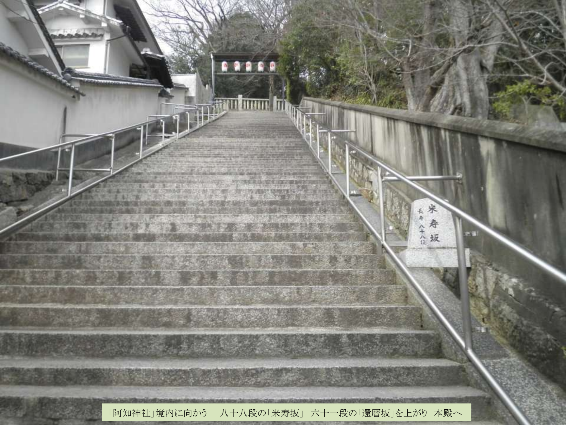
「阿知神社」境内に向かう 八十八段の「米寿坂」 六十一段の「還暦坂」を上がり 本殿へ