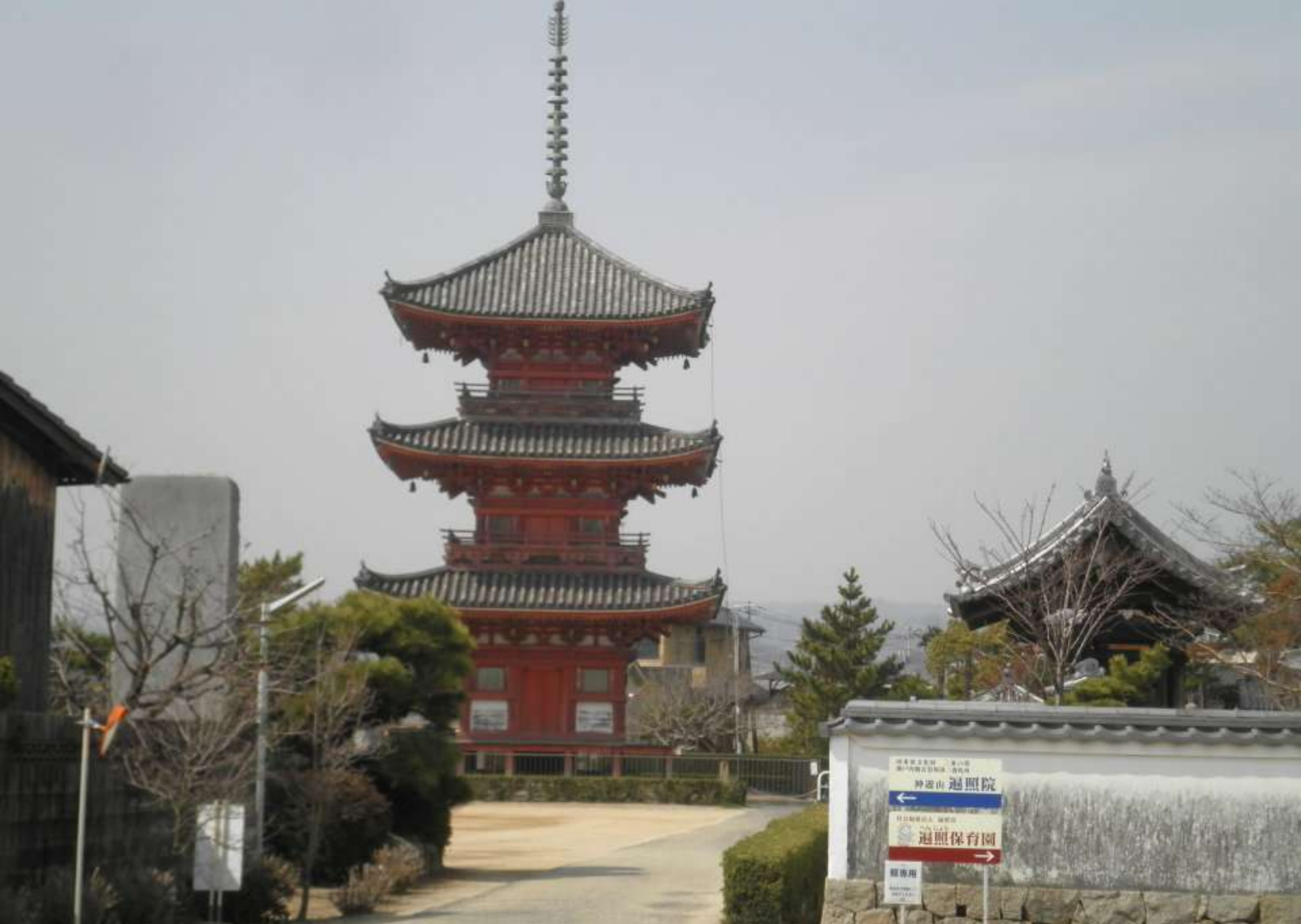
地図はA3白黒 曲がり角に目印の名前が書いてあり 混乱する事はほとんど無かった .. ここは「遍照院」