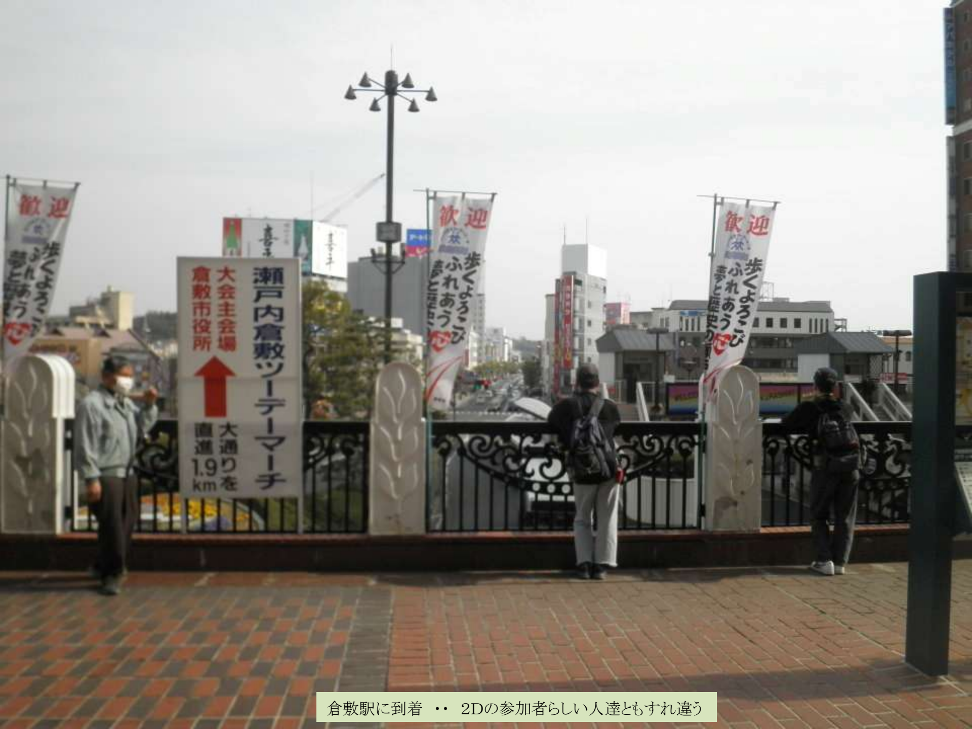
倉敷駅に到着・・・2Dの参加者らしい人達ともすれ違う