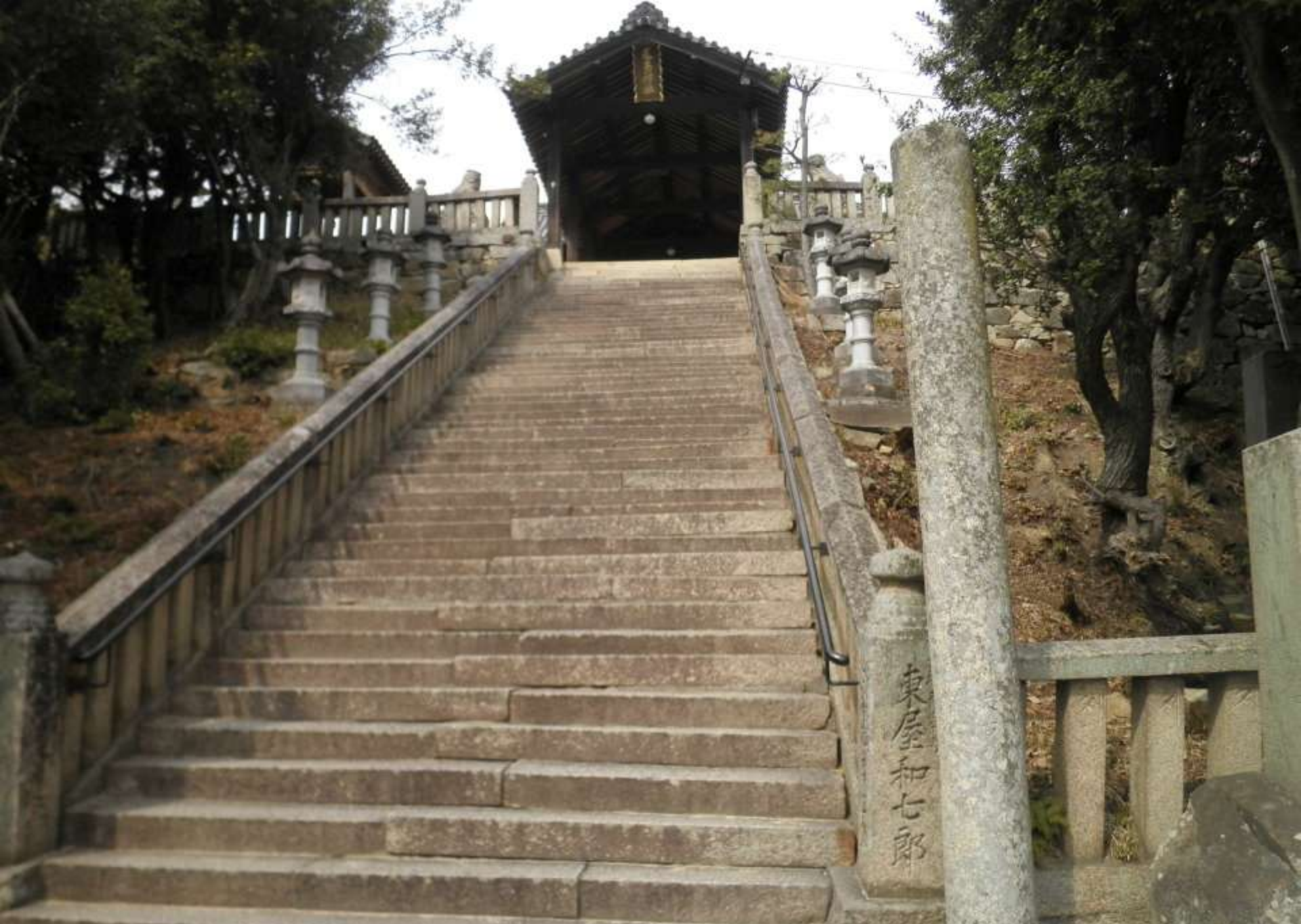
その後陸続きになった。足高山 67m 山頂に神社がある 江戸時代後期まで「葦高神社」と表記された