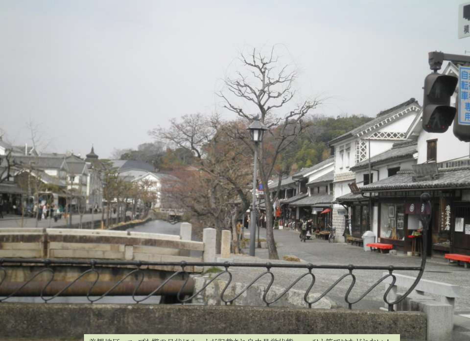
美観地区 マップも櫛の目状にルートが記載され自由見学状態・・ひと筆ではたどれない！