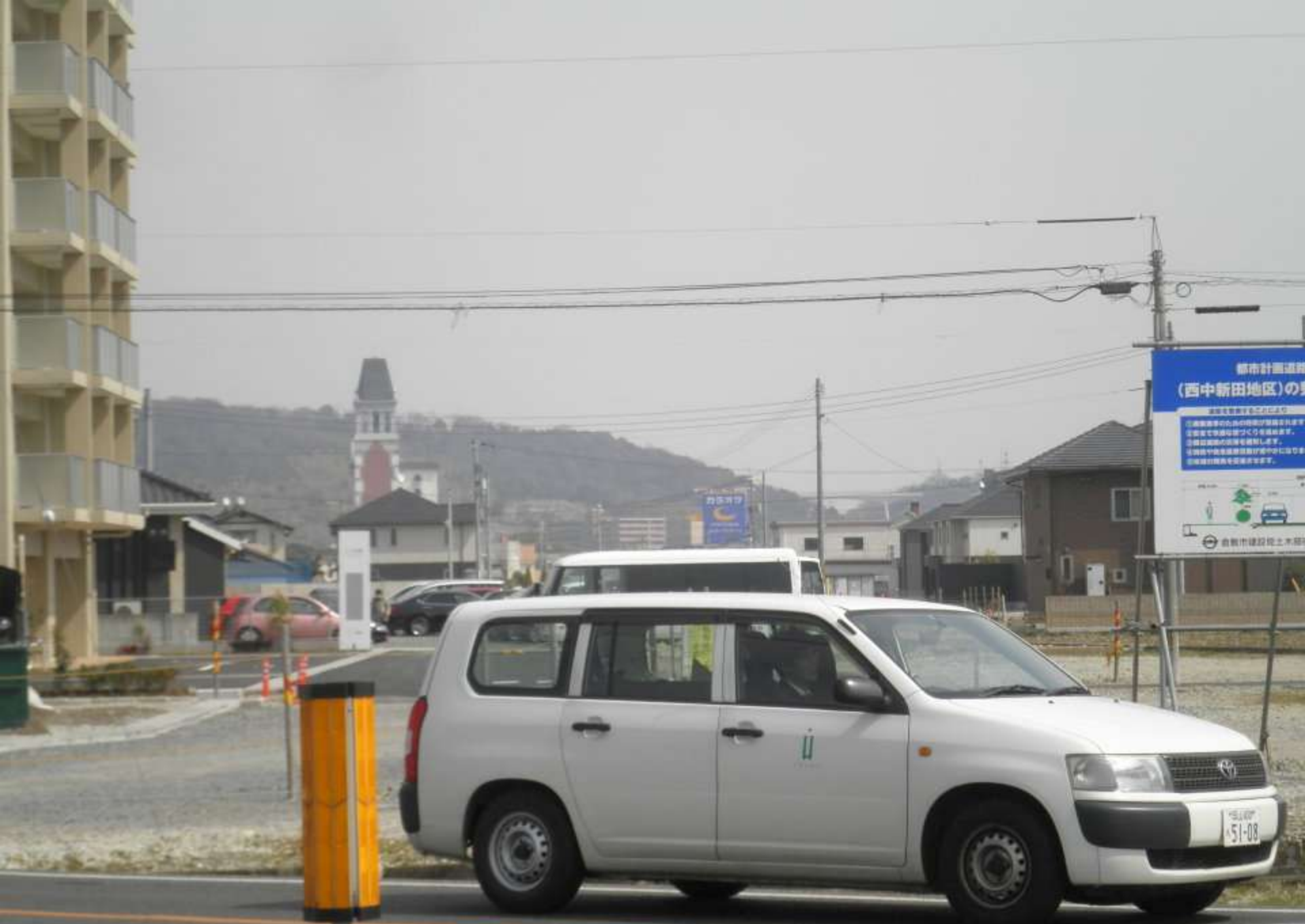
東の彼方に「倉敷市役所」の建物。特徴のある建物で良い目印になる。コースは更に右手に南下