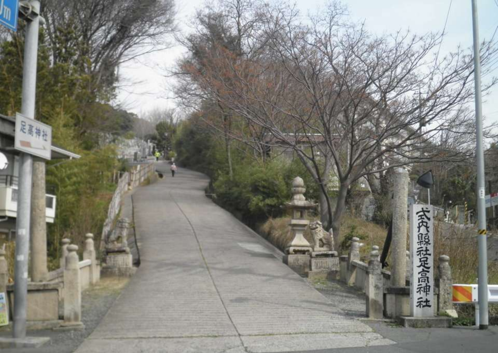
コース最南端の「足高神社」・・ 地図裏面の解説によると 400年前は「笹島」と呼ばれる小島だった・・ とある。